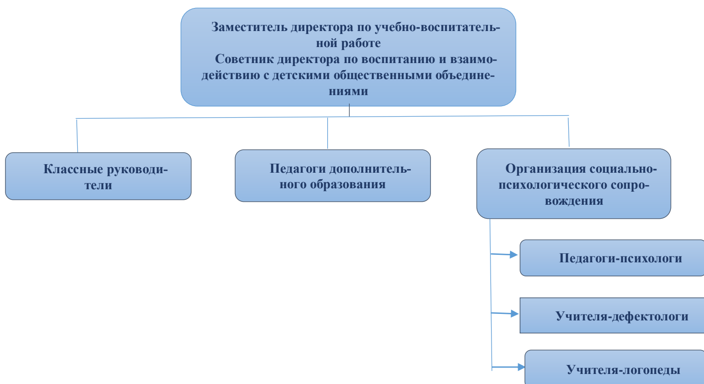
Схема 2. Кадровое обеспечение реализации программы воспитания

Управление воспитательной работой обеспечивается кадровым составом, включающим руководителя образовательной организации, заместителя директора по учебно-воспитательной работе, непосредственно курирующего данное направление, специалистов психолого-педагогической службы (педагоги-психологи, логопеды, дефектологи), классных руководителей, иных педагогических работников. Функционал работников регламентируется профессиональными стандартами, должностными инструкциями и иными локальными нормативными актами образовательной организации по направлениям деятельности.