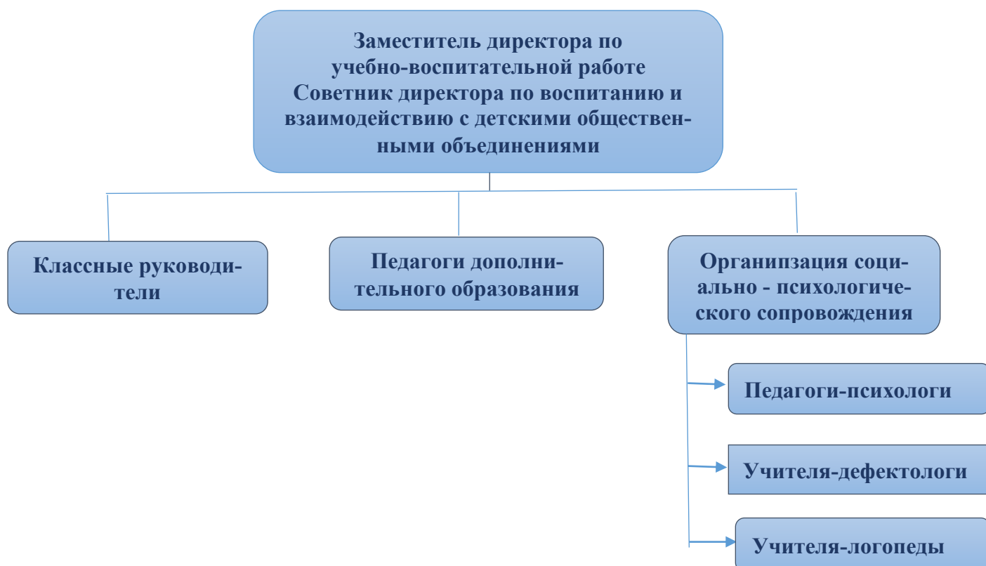
Схема 1. Кадровое обеспечение реализации программы воспитания

Управление воспитательной работой обеспечивается кадровым составом, включающим руководителя образовательной организации, заместителя директора по учебно-воспитательной работе, непосредственно курирующего данное направление, специалистов психолого-педагогической службы (педагоги-психологи, логопеды, дефектологи), классных руководителей, иных педагогических работников. Функционал работников регламентируется профессиональными стандартами, должностными инструкциями и иными локальными нормативными актами образовательной организации по направлениям деятельности.